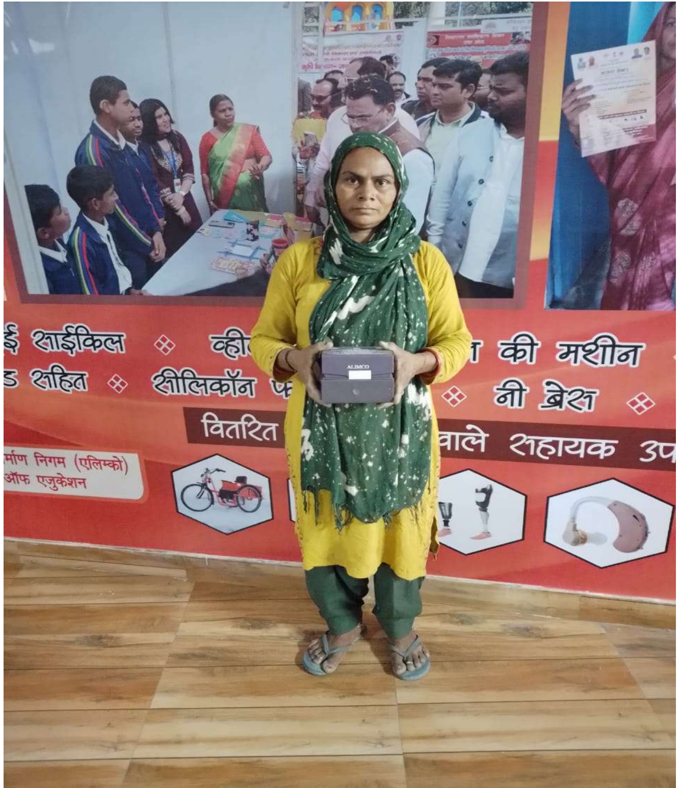
दिव्यांगजनों और वरिष्ठ नागरिक को जांच एव निःशुल्क सहायक उपकरण वितरण विजय एकेडमी ऑफ़ लर्निंग समिति गाजियाबाद द्वारा 2023-24