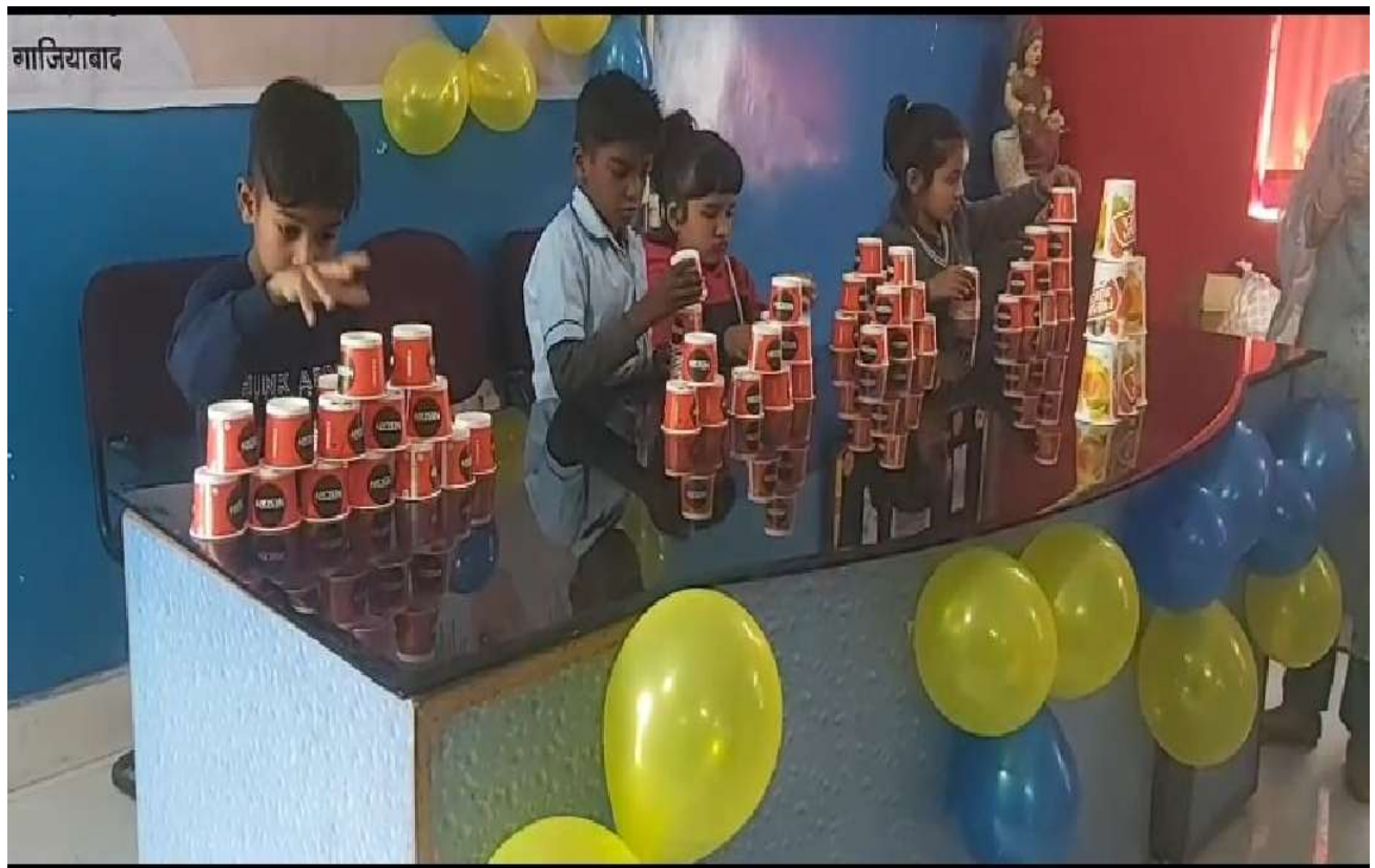
विजय एकेडमी ऑफ़ लर्निंग समिति गाजियाबाद